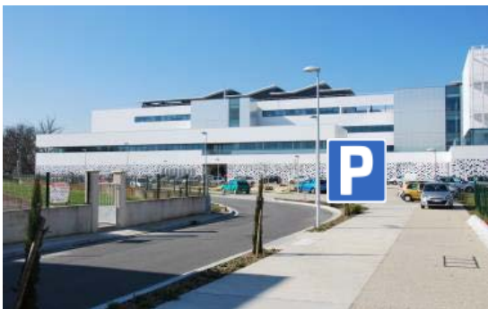
Parking de l'IOA

En cas de difficultés, appelez l'accueil de PYLA au 05 57 01 74 00